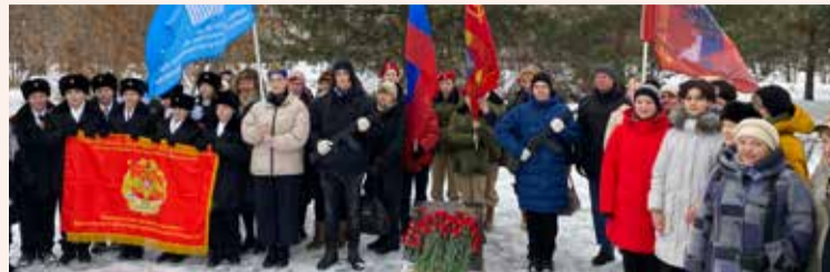
15 февраля Митинг у памятника воинам, павшим в Афганистане, в парке Дружбы

Основные мероприятия, организованные администрацией и Советом депутатов муниципального округа Головинский в 2023 году