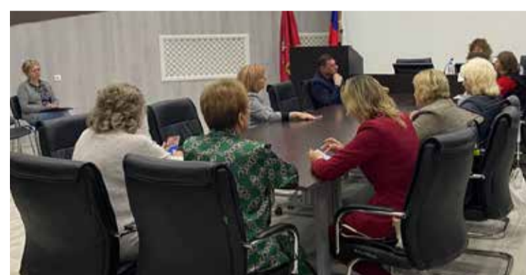
Заседание Совета депутатов муниципального округа Головинский

— На Головинских прудах и раньше купались, но все это было несанкционировано, а теперь здесь появилась современная зона отдыха. Конечно, пробы воды в сезон будут регулярно проходить проверку, может так получится, что Роспотребнадзор выдаст запрет на купание, но все равно в районе будет место для комфортного отдыха у воды, — отмечает глава муниципального округа. — В планах — облагораживание Кронштадтского бульвара, где недавно