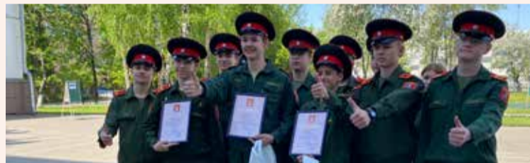
13 мая Военно-патриотическая игра «Зарница» в Петровской кадетской школе Первого Московского кадетского корпуса