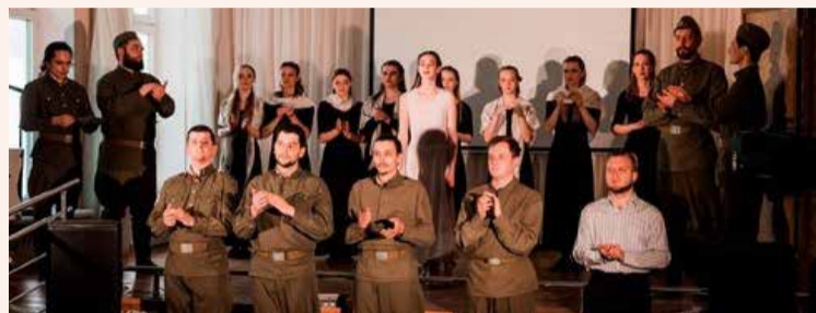
19 апреля Урок мужества в Реабилитационно-образовательном центре № 76 В рамках урока мужества в Реабилитационно-образовательном центре № 76 состоялись спектакли «С любимыми не расставайтесь» по пьесе известного грузинского драматурга Н. Квицинадзе «Ромашка и Ландыш» в исполнении Молодежного музыкально-драматического театра «Крылья».