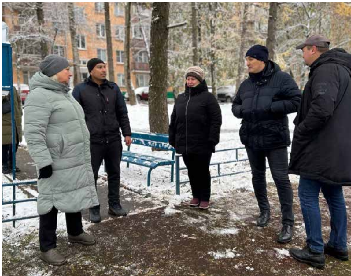
Каждую субботу главы управы или его заместители проводят обход территории, адреса выбираются по обращениям жителей