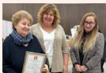
Подведение итогов года, чествование общественников и активистов района На мероприятии были подведены итоги местного конкурса «Мое генеалогическое древо», а общественным советникам и представителям Молодежной палаты были вручены благодарственные письма.